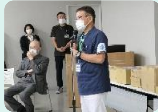
宮脇副院長（共済会会長）