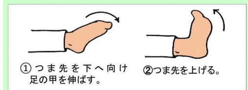
①つま先を下へ向け足の甲を伸ばす。 ②つま先を上げる。