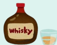
ウイスキー ダブル1杯(60ml)