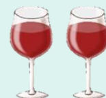
ワイン 2杯 (240ml)