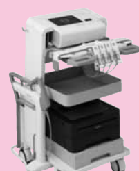
内臓脂肪測定装置