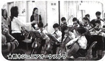
★栃木ジュニアオーケストラ

今後も、このような市民の皆様とふれあう機会、当院を知って頂く機会を充実させ、継続していきたいと考えておりますので、今後もよろしくお願い致します。