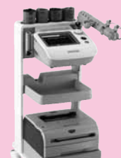
血圧脈波測定装置 (血管年齢測定装置)

この2つの検査は、気軽にX線の被曝なく、血管年齢と内臓脂肪を測定することができ、日本の3大死因として挙げられている『脳血管疾患』『心疾患』の原因となる「動脈硬化」の発見を容易にし、それらの病気の予防に一層役立つ魅力的な検査機器です。