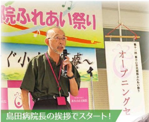
島田病院長の挨拶でスタート!