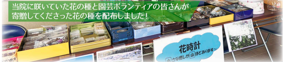
当院に咲いていた花の種と園芸ボランティアの皆さんが 寄贈くださった花の種を配布しました!