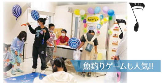
魚釣りゲームも人気!!