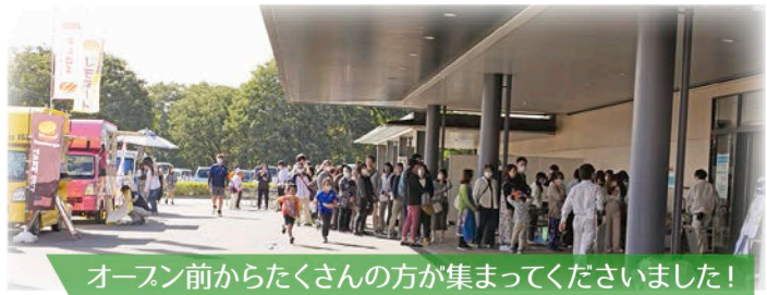
オープン前からたくさんの方が集まってくださいました!