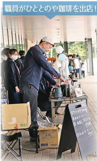
職員がひととや珈琲を出店!