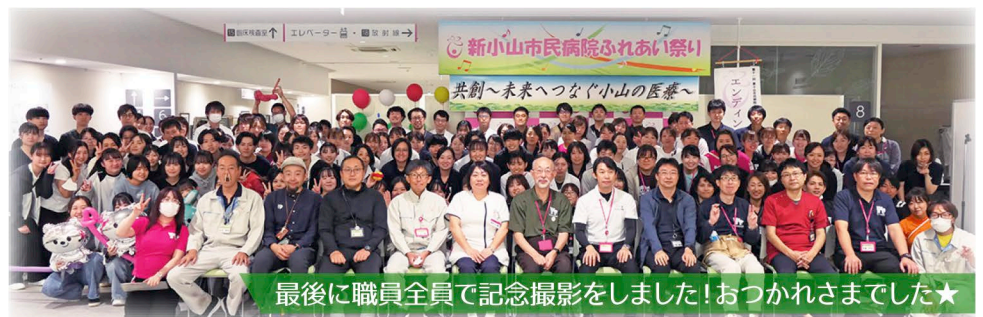
最後に職員全員で記念撮影をしました!おつかれさまでした★