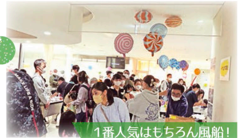
1番人気はもちろん風船!