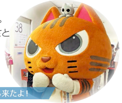
ふうにゃ&むむにゃも来たよ!

職員一同、地域の皆様が寄せる市民病院へのご期待とご厚情の大きさと温かさに触れ、感謝の気持ちでいっぱいになりました。来年もより一層お楽しみ頂けるよう、たくさんのイベントや体験コーナーを企画してまいります。お越し頂きました皆様、ありがとうございました。