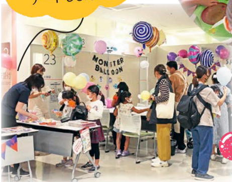
スーパーボールすくいにも、 たくさんの方が 参加してくれました!